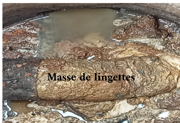
Masse de lingettes