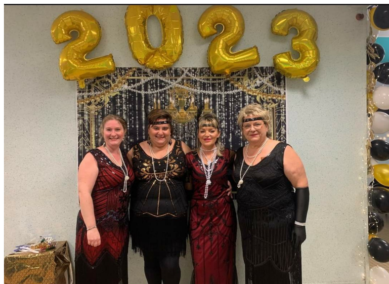
Réveillon de la Saint Sylvestre