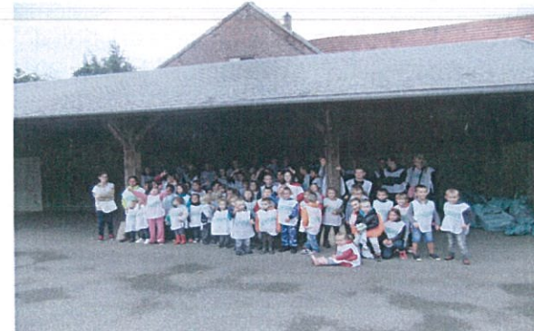
Les élèves de CM2 de l'école de Conchy-les-Pots

Neela : On a nettoyé la nature sur les trottoirs, dans le village jusqu'à la mare.