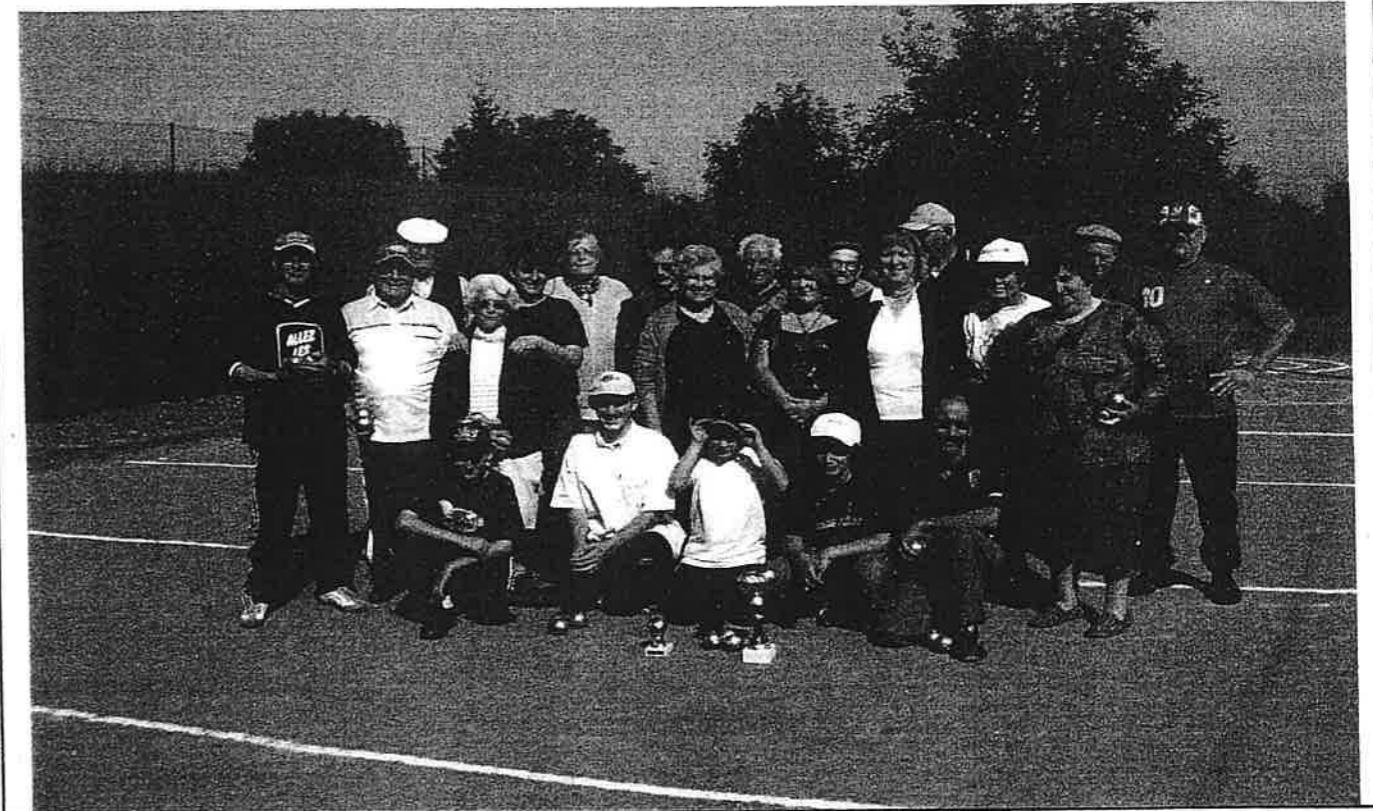
Les vacances sont finies...