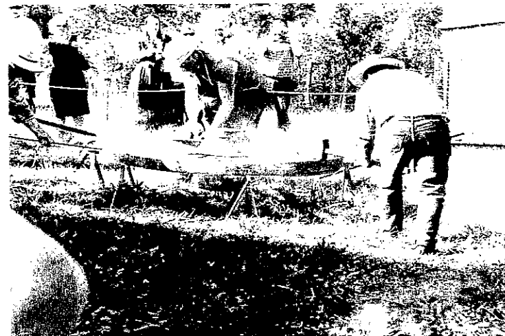
Pas facile de ferrer cette roue